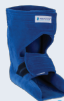
Chaussure bandage / protecteur entier

Au bout de 6 mois d'un usage très intensif, REBACARE® conseille de vérifier le produit régulièrement pour des raisons de nettoyage et d'hygiène (exsudat) et au besoin de le remplacer.