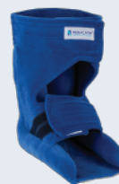
Orthopedic Bandage shoe / heel protector

After intensive use for a period of 6 months in terms of cleaning and hygiene (exudate), REBACARE® recommends that the product is regularly inspected and replaced if necessary.