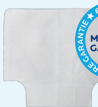
Bovenkant van Turnability

Maten: breed 67 cm x lengte 35 cm x dikte 12 cm BASIC UDI-DI: 87202564297774V5