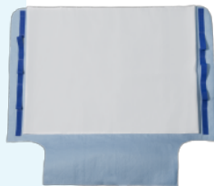
Onderkant van Turnability